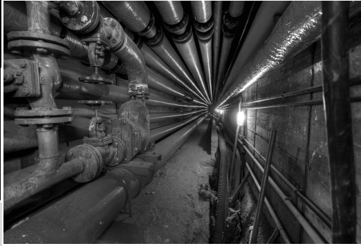
Blick in das Tunnelsystem